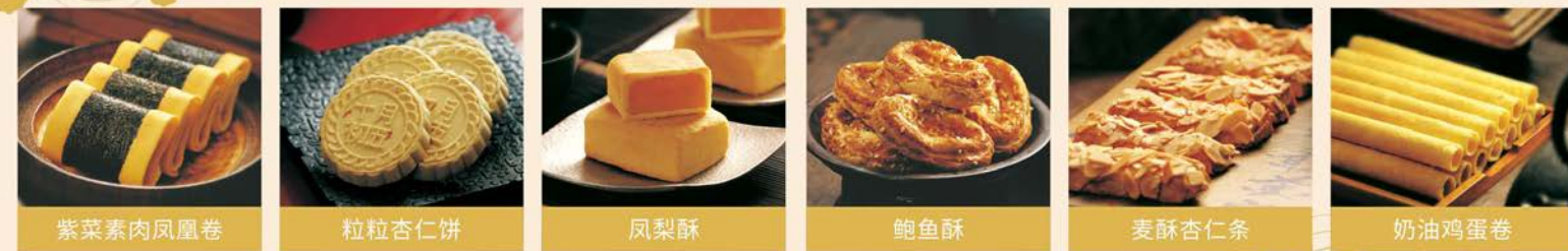
紫菜素肉鳳凰卷 粒粒杏仁餅 鳳梨酥 鮑魚酥 麥酥杏仁條 奶油雞蛋卷