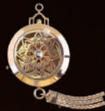
3. AO二十週年紀念香水罐

含有真澳門代表性的「蓮花」萃取精，具有保溼、平衡、活膚、排毒等效果。優質睡眠需要寧靜的環境，而夢蓮靈淨睡眠面膜更可在您熟睡的同時，有效效地潔淨您的肌膚，令您一覺醒來肌膚潔淨如初。