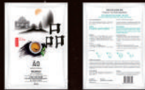
1. AO鳳凰茶貢品喚醒面膜，30g x 3片

為慶祝澳門回歸二十週年，AO特別推出回歸二十週年紀念禮盒。禮盒外包設計以澳門回歸作為設計概念元素，將澳門著名世遺古蹟—大三巴牌坊、媽祖閣和東望洋燈塔，澳門金蓮花廣場、回歸20週年、煙花等元素分佈在外包設計盒上，意為用美麗的煙花淋漓盡致地渲染澳門回歸祖國20週年來的持續發展，社會的安定與繁華。